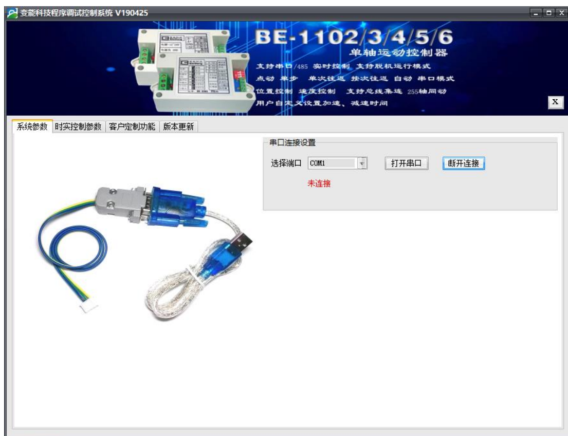
图 2.2 打开串口