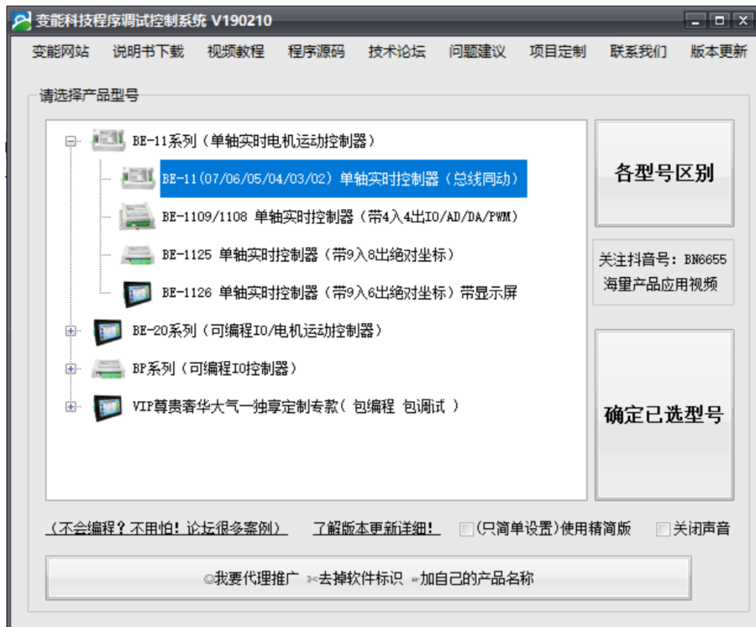
图 2.1 选择型号